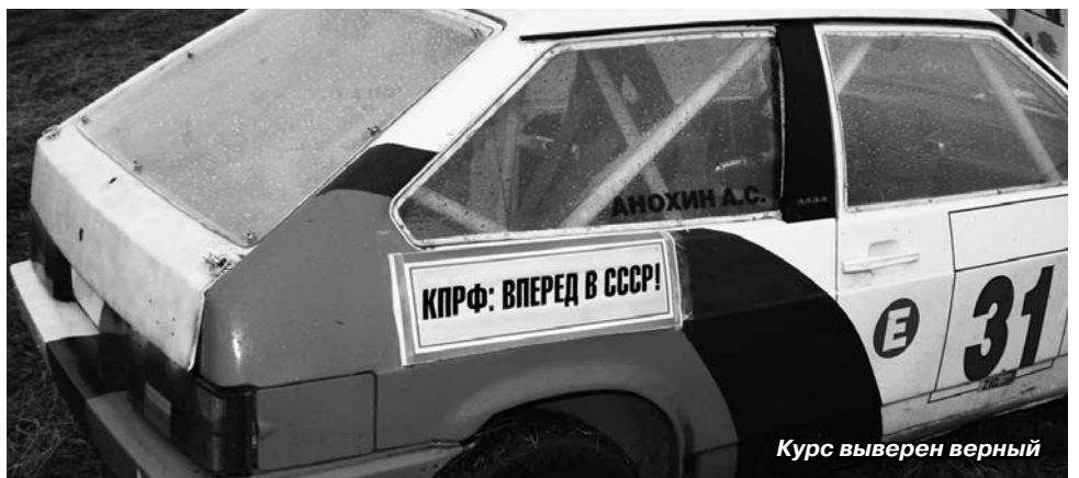
Курс выверен верный

контролем. Помните: вы не наемники управляющих компаний, но — работодатели! Это вы должны с них требовать ответов на все ваши вопросы!».