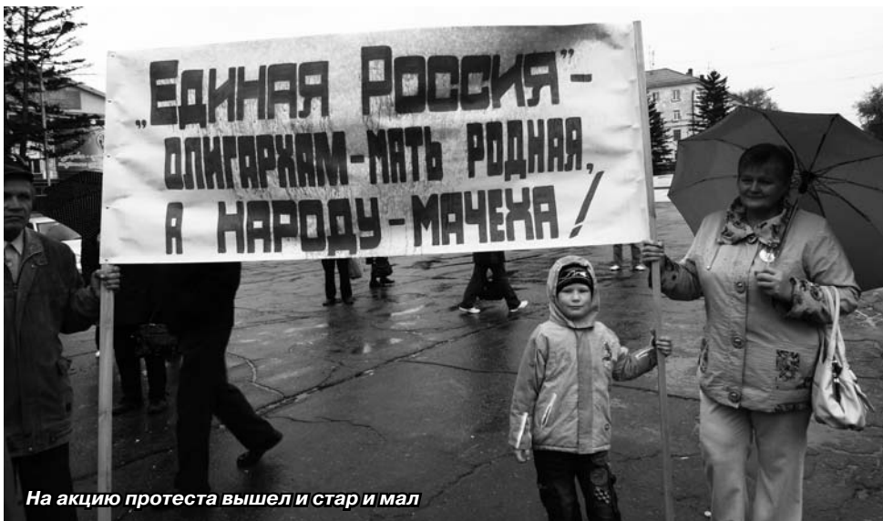
На акцию протеста вышел и стар и мал

Лидер рубцовских коммунистов призвал горожан не бояться, а грамотно и последовательно отстаивать свои жизненные интересы: «Достаточно судей, которые примут сторону рубцовчан... Сейчас разрабатывается положение, по которому управляющие компании не будут взимать плату за коммунальные услуги, а будут брать только за содержание жилья, которое будет под вашим