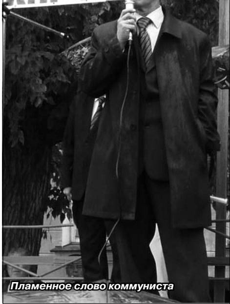
Пламенное слово коммуниста