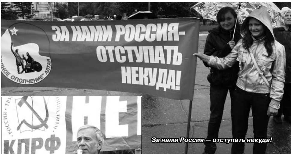
За нами Россия — отступать некуда!