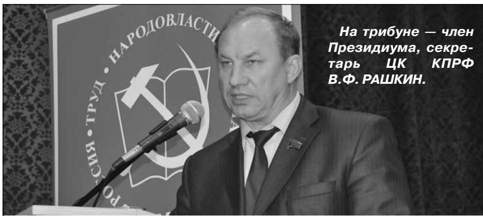
На трибуне — член Президиума, секретарь ЦК КПРФ В.Ф. РАШКИН.

21-22 января 2011 года в Подмосковье проходил семинар-совещание руководителей комитетов и штабов по выборам региональных отделений КПРФ