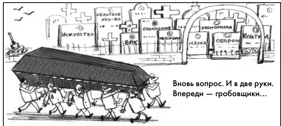
Вновь вопрос. И в две руки. Впереди — гробовщики...

Информационное сообщение о собрании коммунистов Ленинского района