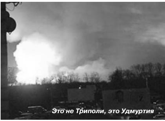
Это не Триполи, это Удмуртия