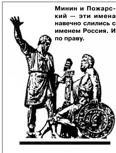
Минин и Пожарский — эти имена навечно слились с именем Россия. И по праву.