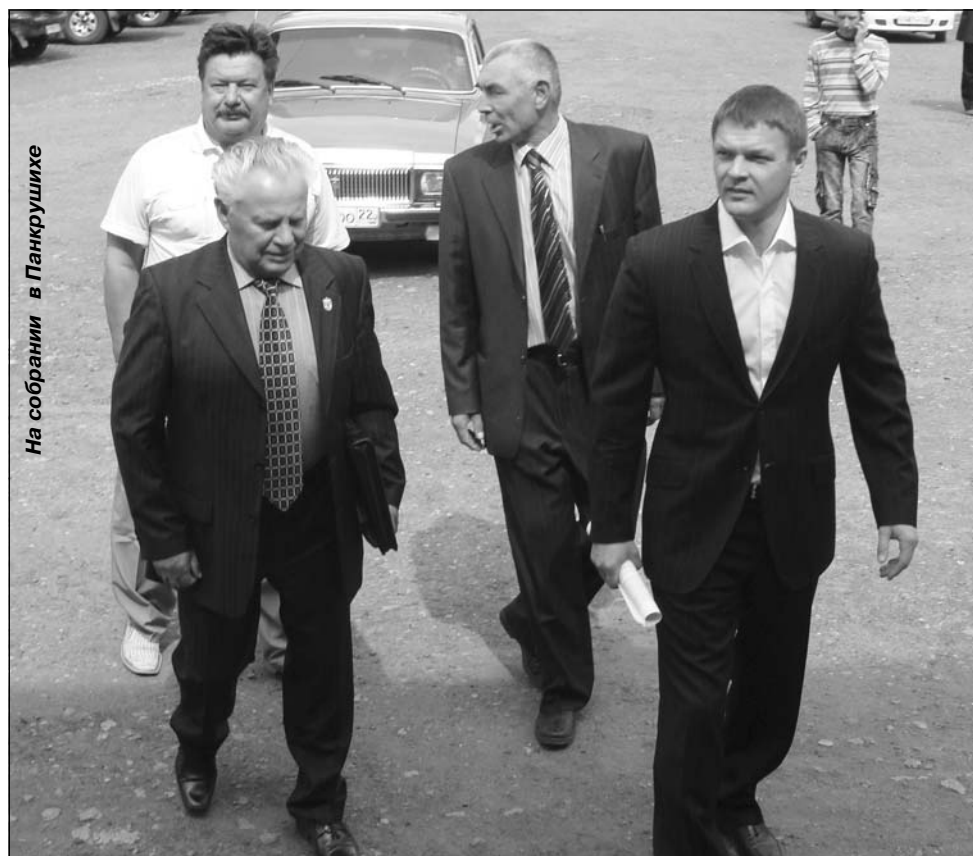
На собрании в Панкрушихе