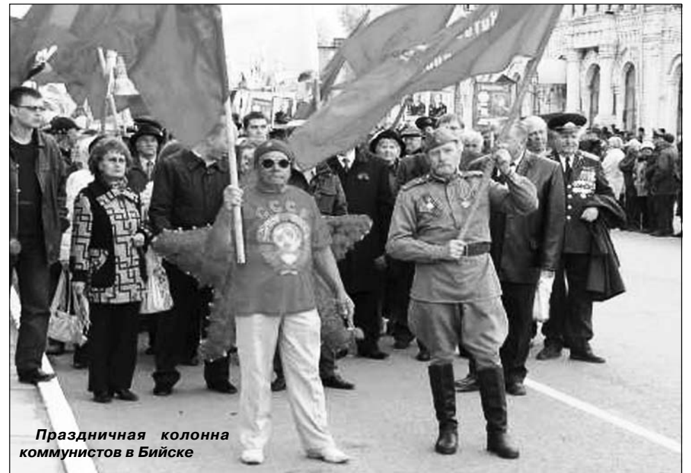
Праздничная колонна коммунистов в Бийске