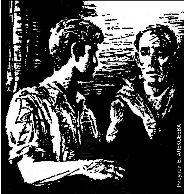
Рисунок В. АЛЕКСЕЕВА

окна домов недалеко Северо-Чемского жилмассива. Темнела, а потом стала угольно-черной на фоне звездного неба Бугринская роща. Только и виднелись в ней, выделяясь своей чужеродной готичностью, освещенные корпуса католического приюта для малолетних брошенных матерей-одиночек. С горечью уязвленного патриотизма мы вполголоса говорили о постыдности для страны самого существования этого очага заезжего и малопонятного милосердия. Свои болячки самим и лечить надо бы.