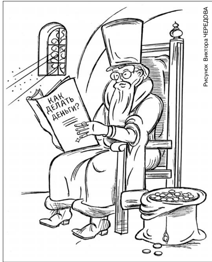
Рисунок Виктора ЧЕРЕДОВА

Но на самом деле схема немножко другая для Европы. Схема следующая.