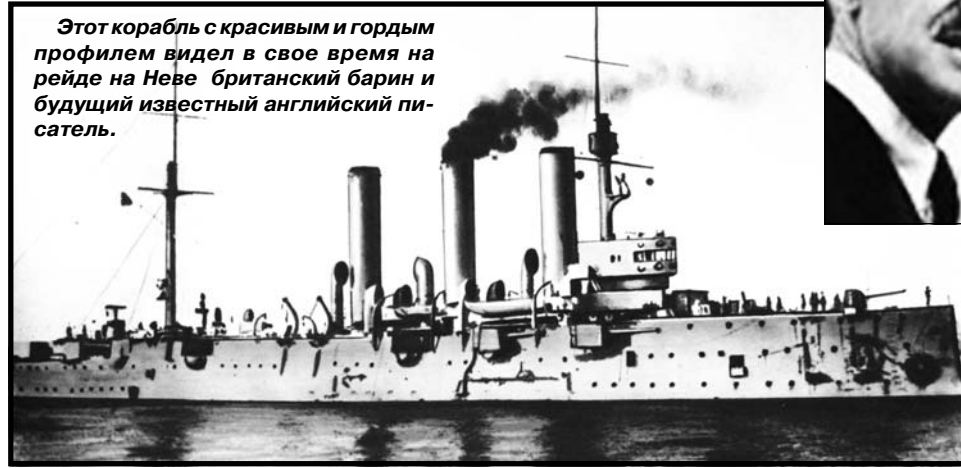
Этот корабль с красивым и гордым профилем видел в свое время на рейде на Неве британский барин и будущий известный английский писатель.

И наконец грянула буря. В ночь на 7 ноября 1917 года большевики встали, министры Керенского были арестованы, Зимний дворец разграблен толпой; власть захватили Ленин и Троцкий».