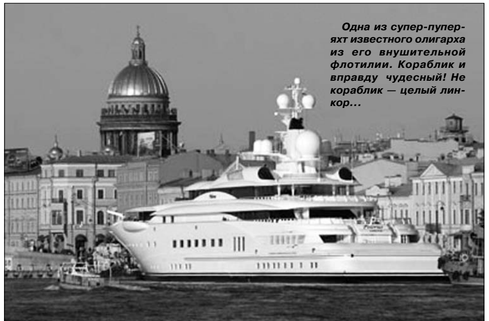
Одна из супер-пупер-яхт известного олигарха из его внушительной флотилии. Кораблик и вправду чудесный! Не кораблик — целый линкор...

Так что вместе с Романом порадуемся российской демократии. При тоталитарном режиме разве для такой радости был бы у нас повод?