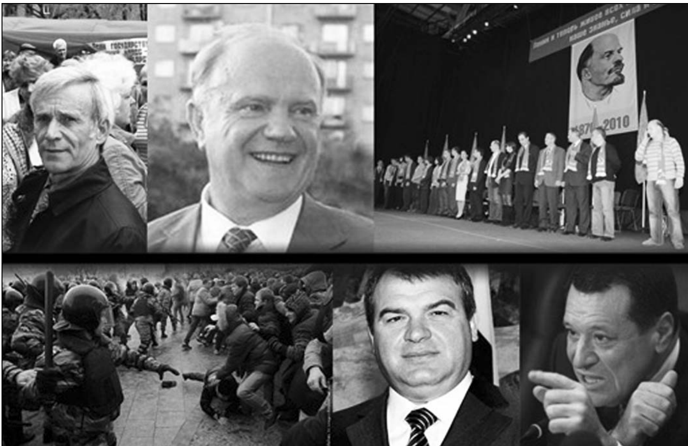
Фотокомпозиция с центрального партийного сайта КПКРФ