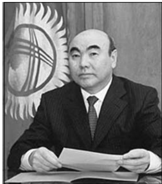
Когда-то и Аскар АКАЕВ сулил своему народу золотые горы.