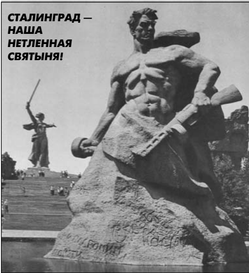
СТАЛИНГРАД — НАША НЕТЛЕННАЯ СВЯТЫНЯ! Так защищали наши отважные герои Сталинград! Есть у кого нам поучиться мужеству, защищая сегодня честь и достоинство великого генералиссимуса, наше великое знамя, которое мы воодрузили над поверженным в прах Рейхстагом. Только так действуй — как они, защищая наши святыни — ни, шагу назад! Знай, наше дело — правое!

Уважаемая редакция! Мы много посвящаем стихотворений фронтовикам мужчинам, и очень мало, на мой взгляд, труженицам тыла. Это стихотворение посвящается нашим бабушкам и матерям, принявшим на свои женские плечи немалую долю тяжести войны.