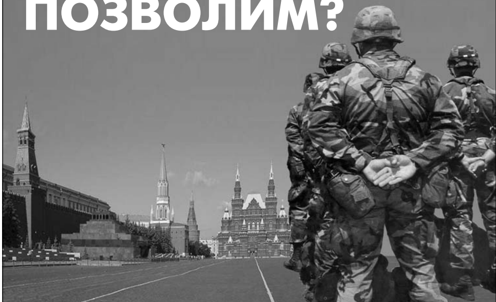
Плакаты Олега ЖУКАНОВА