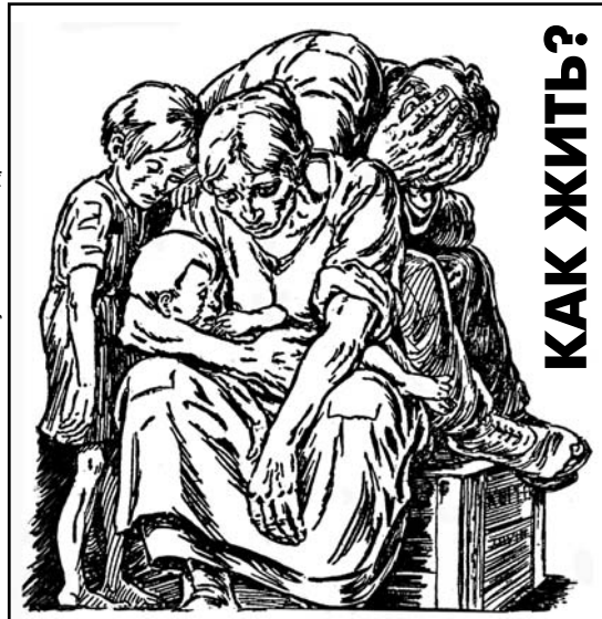
Рисунок Александра МАЖАТСКОГО