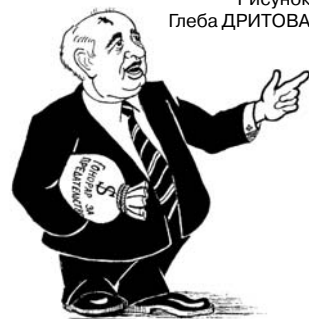
Рисунок Глеба ДРИТОВА

И наконец — август 1991 года. Почва для контрреволюции была уже подготовлена. В Москве к этому времени нарастала кризисная ситуация, начались беспорядки. Во многом их провоцировали многочисленные «советники» ельцинского руководства из западных спецслужб. Президент Горбачев, вместо того чтобы принять решительные меры по наведению порядка, отбыл в Крым на отдых. Многие средства массовой информации развернули оголтелую антисоветскую кампанию. Малейшие ошибки, недостатки прошлых лет раздувались до невероятных размеров и использовались для дискредитации социализма и Советской власти. С особой изощренностью стали публиковаться материалы, посвященные сталинскому периоду. В этой обстановке 19 августа 1991 года руководство страны приняло решение о создании ГКЧП — государственного комитета по чрезвычайному положению. Члены ГКЧП хотели сохранить СССР, предотвратить его развал и навести порядок в столице. В Москве был установлен комендантский час, в город были введены воин-