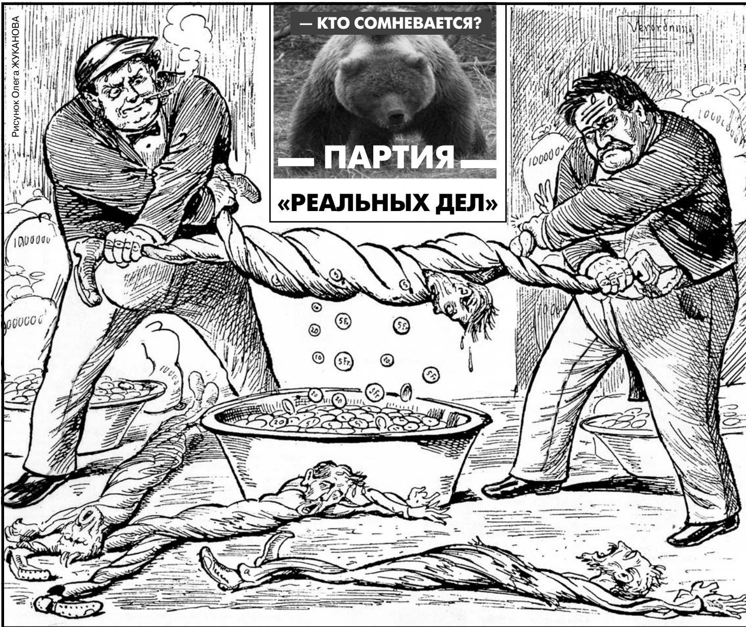
Рисунок Олега ЖУКАНОВА