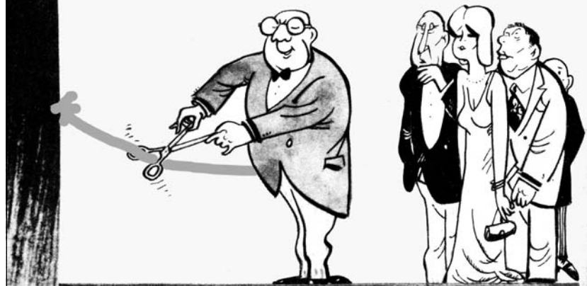
Рисунок Эвальда ПИХО