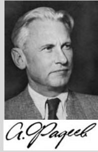
Александр ФАДЕЕВ сегодня не принадлежит к писателям популярным. И это не его вина. Как, впрочем, и не его беда. Это и беда, и вина нашего времени, а не этого поистине блистательного и крупного писателя, одного из лучших наших советских писателей. Даже снисходительное — «Фи!» — нынешних знающих все и вся невежд в его адрес вы сегодня, наверное, вряд ли услышите. Его сегодня просто не знают, в отличие скажем, от Горького или Шолохова, к которым счет претензий литературных гурманов и поклонников Солженицына и Владимира Войновича велик и не-