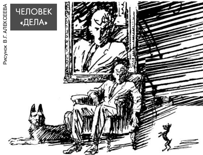
Рисунок В.Г. АЛЕКСЕЕВА

Гиммер знал, что тысячи людей, работающих на него, не любят, ненавидят его; что все богатые люди, которых он принимает в доме, завидуют ему как удачливому конкуренту и презируют его как выскочку что сам он, человеке образованный, чужд всей своей образованной семье; что никто из его потомства не интересуется его делом и не способен продолжать дело после его смерти; что жена его — ханжа и лицемерка; что старший сын его — толстый высокопарный бездельник; что средний сын его, учившийся в другом городе в кадетском корпусе, стыдится происхождения отца; что младший сын его — вырожденец; что дочери его некрасивы и не способны в ученье; что он сам уже стар и близок к могиле. Гиммер знал все это, и все-таки он всеми силами поддерживал тот строй и порядок жизни, в котором жил, и вступил бы в борьбу со всяким, кто попытался бы изменить этот порядок.