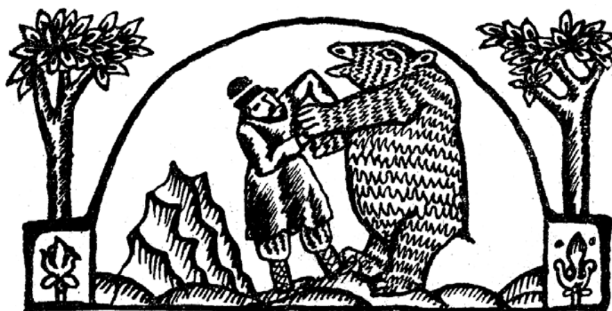
Рисунок С.А. Острова из книги «Русская бытовая сказка», 1987 г.