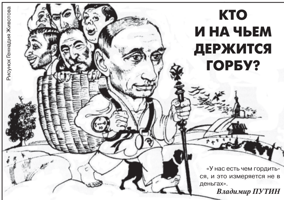
Рисунок Геннадия Животова

Русский Forbes опубликовал новый рейтинг богатейших людей России. В этом году список расширили — вместо «золотой сотни» получилась «двухсотка». Общее состояние бизнесменов эксперты оценили в $499 млрд. Только на первую сотню «форбсов» приходится $432 млрд. ($297 млрд. в 2010 году). Но главный рекорд не в этом — Россия в очередной раз переплюнула сама себя и за прошедший год выкормила 39 новых долларовых миллиардеров. Теперь их у нас 101 человек.