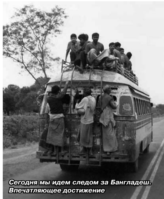
Сегодня мы идем следом за Бангладеш. Впечатляющее достижение

Таким образом, Россия по численности населения сегодня находится на 8-м месте в мире (сразу после Бангладеш). А еще наша нация стремительно стареет: средний возраст россиянина сегодня —